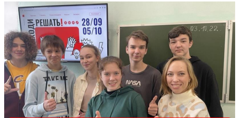
Чална (республика Карелия)