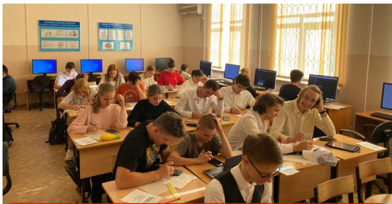
Хабаровск (Хабаровский край)