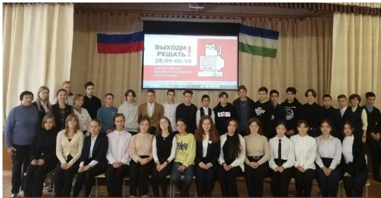
Благовещенск (Амурская область)