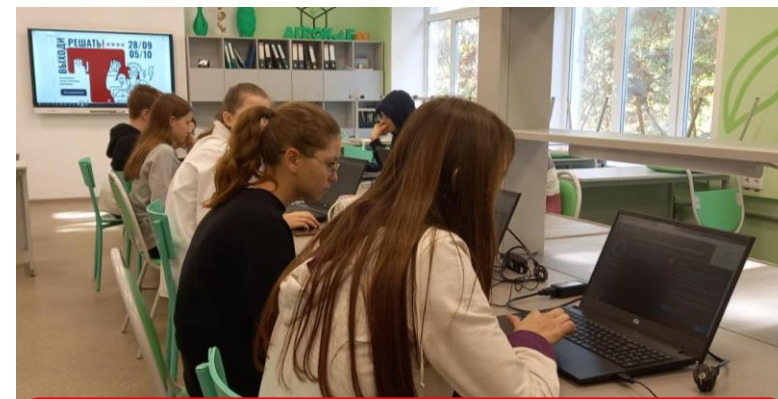
с. Патруши (Свердловская область)