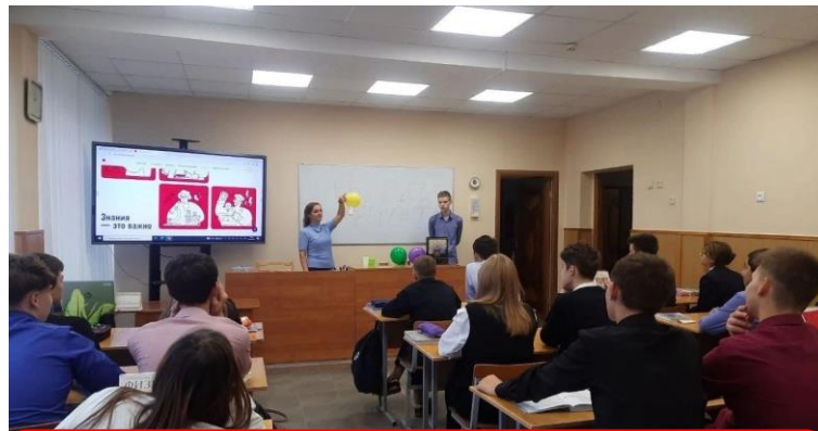
Курск (Курская область)