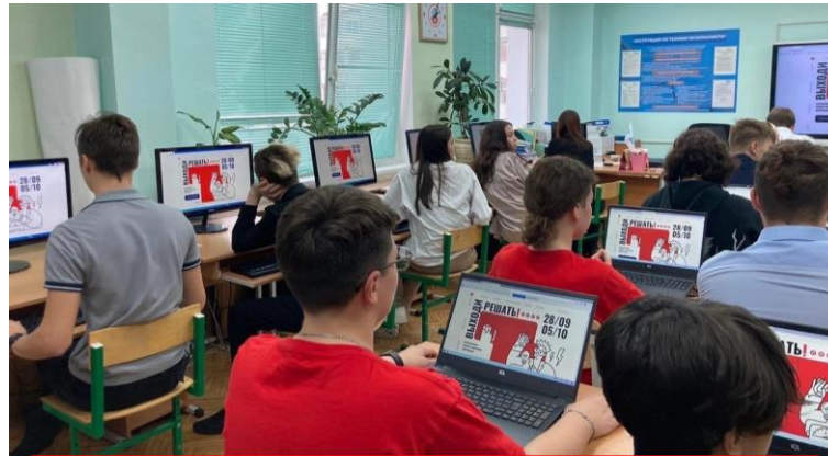
Новый Уренгой (Ямало-Ненецкий АО)