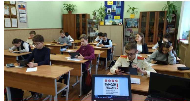
Дмитров (Московская область)