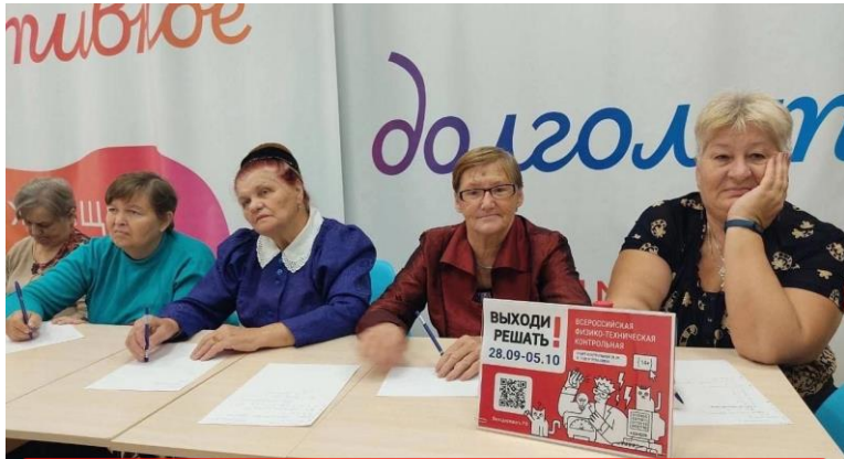
Серебряно-Прудский район (Московская область)