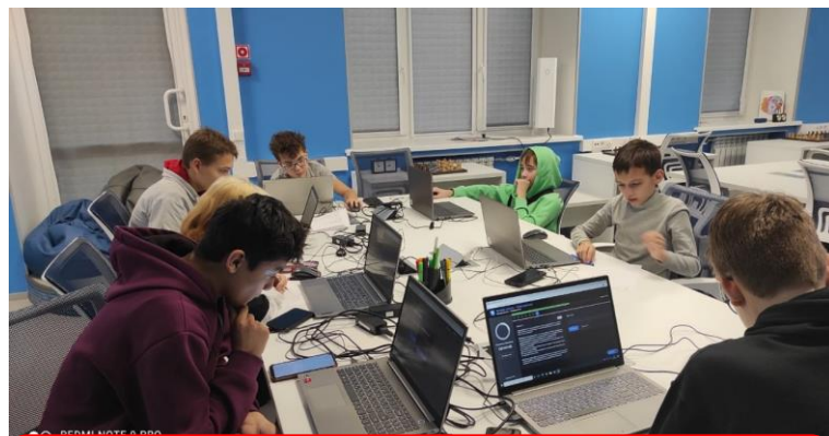
Мурманск (Мурманская область)