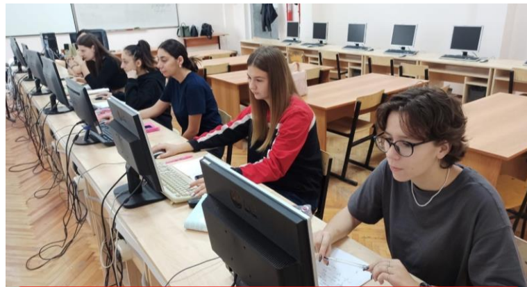
Таганрог (Ростовская область)